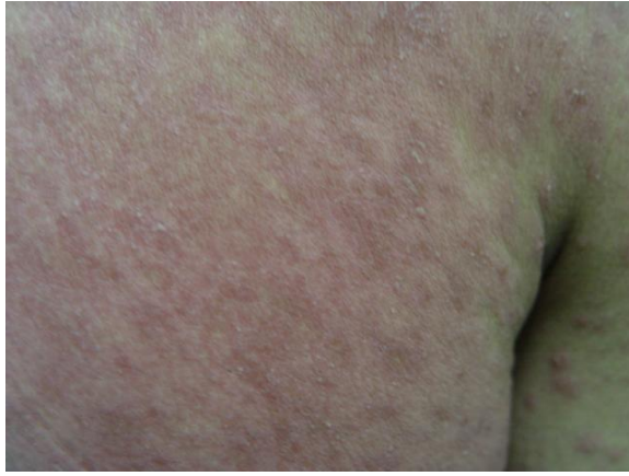
Resim 1. Yaygın eritemli zemin üzerinde yüzeyel püstüller

21 yaşında erkek hasta kliniğimize 5 gün önce başlayan yaygın döküntü nedeniyle başvurdu. Döküntüler önce sırttan başlamış ve giderek tüm vücuda yayılmış. Hastaya 3 hafta önce Reynould fenomeni tanısıyla diltiazem, aspirin ve pentoxyphylline başlanmış. Hastanın tüm vücuduna yayılan, eritemli zemin üzerinde yüzeyel püstüller gözlemlendi ( Resim 1 ).